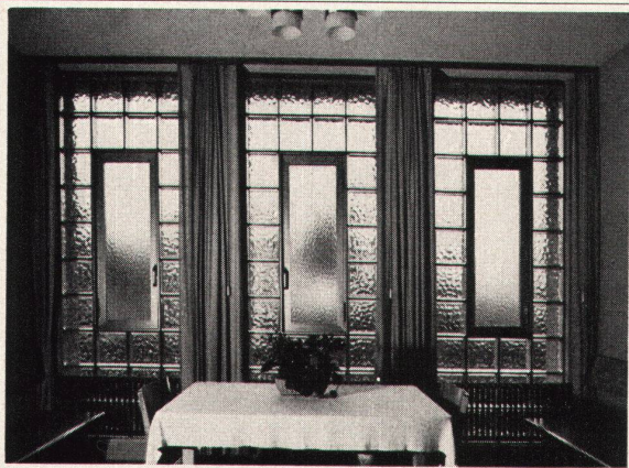
Glasbausteinfenster mit Anticorodal-Drehflügel in Sitzzimmer.

Glasbausteine bieten viel mehr Gestaltungsmöglichkeiten als die konventionelle Verglasungsart. Lichtstreuung, Isolation, Schalldämmung, Sicherheit gegen Feuer und Einbruch, und dauernde Glasklarheit stempeln den Glasbaustein zum modernen, exklusiven Bauelement.