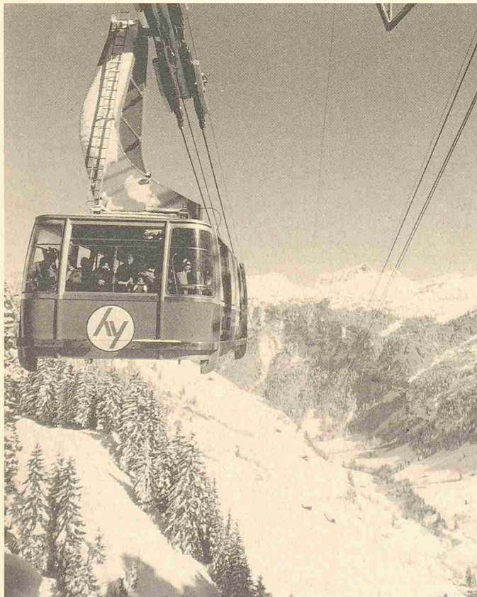
Luftseilbahn Hoch-Ybrig wird von ABB umgebaut