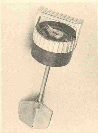
Konsistenzmessgerät Plastimeter P 86