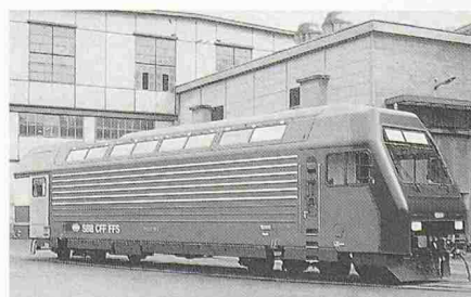
S-Bahn-Lokomotive Re 4/4 V der SBB