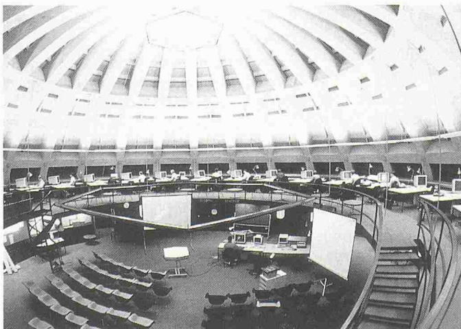
Bild 1. Das CAETH-Zentrum der ETH Zürich

Sämtliche Industrieländer unternehmen zur Zeit grösste Anstrengungen, um auf diesem Gebiet Fortschritte zur Verbesserung der Konkurrenzfähigkeit ihrer Industrie zu machen. CIM ist nicht nur anwendbar für Grossunter-