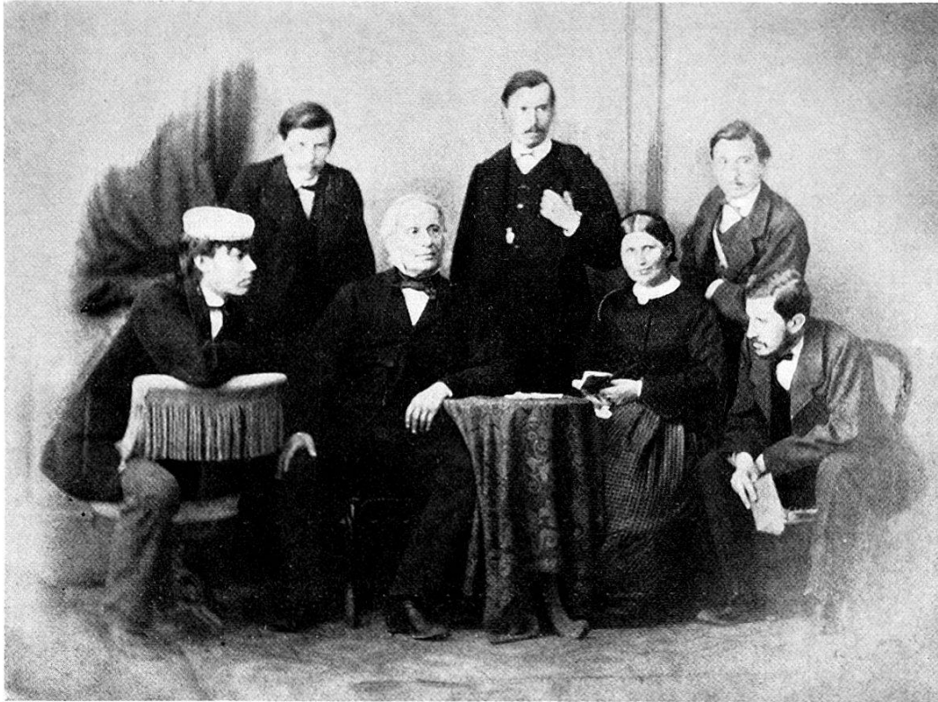
Abb. 5. «Familie Miescher-His»; im Nachlaß Karl Frey.