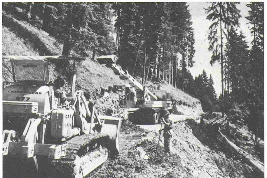
Bild 1. Im Berggebiet ist der Bau von Waldstrassen oft mit grossen Schwierigkeiten verbunden und bedeutet immer einen grossen Eingriff in die Natur (Foto im Simmental: FZ).

Die Tatsache, dass Forstdienste und Forstbetriebe lastwagenbefahrbar Strassen fordern, kann nur anhand des bestehenden Zusammenhangs zwischen Waldpflege und Holznutzung erklärt werden, denn diese Strassen werden hauptsächlich durch den Abtransport des geschlagenen Holzes bedingt.