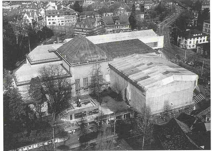
Die Sanierungsarbeiten am Zürcher Kunsthaus gehen in diesem Herbst ihrem Ende entgegen