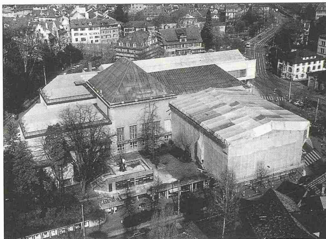
Die Sanierungsarbeiten am Zürcher Kunsthaus gehen in diesem Herbst ihrem Ende entgegen