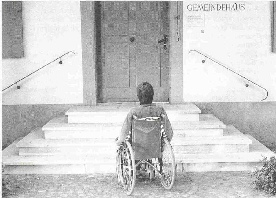
Eine typische und für Behinderte leider immer noch alltägliche Situation...

Der «Leitfaden» sowie Adressen von regionalen Beratungsstellen sind kostenlos erhältlich beim Schweiz. Invalidenverband SIV, Frohburgstrasse 4, Postfach, 4601 Olten, sowie bei der Schweizerischen Fachstelle für behindertengerechtes Bauen, Neugasse 136, 8005 Zürich.