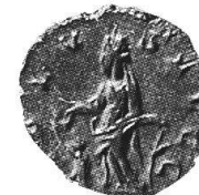
47 - 50