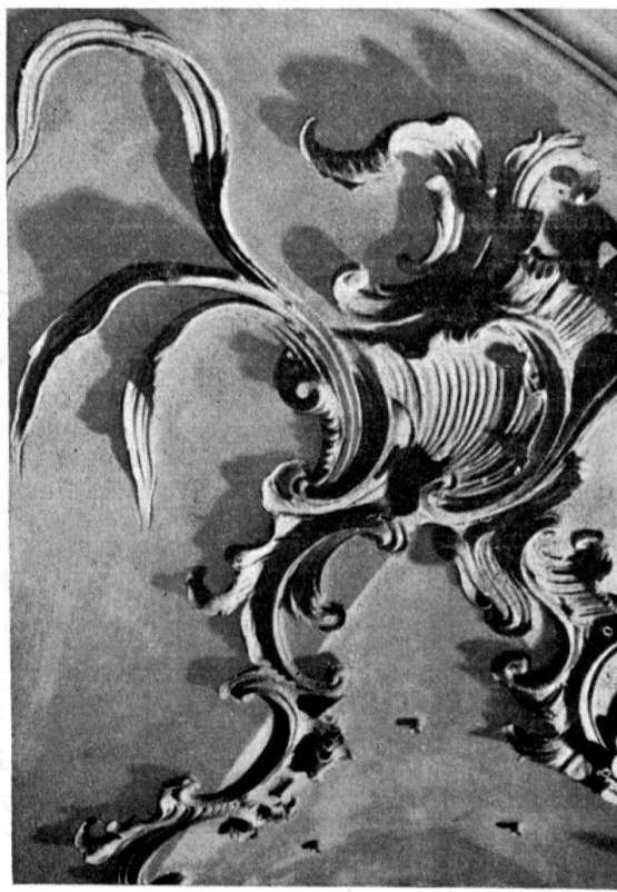
Stukkaturen in der Kirche von Hombrechtikon