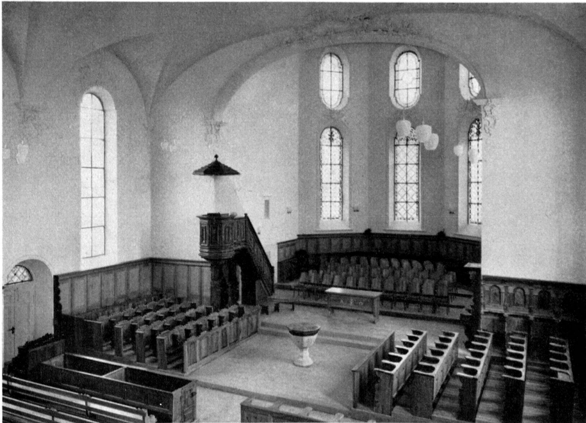
Inneres der Kirche von Hombrechtikon nach der Wiederherstellung