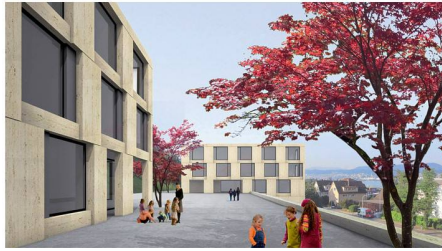
04 «Limited Edition»: aufwendige Fassaden