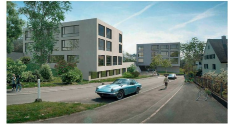
05 «Ernie &amp; Bert»: auf massivem Sockel

les System aus Klassen- und Gruppenräumen, die mit den innen liegenden und über Innenhöfe mit Tageslicht versorgten Halbklassen zusammengeschaltet werden oder einen Cluster mit zwei Klassen bilden können. Sämtliche öffentlichen Räume liegen gut auffindbar im Eingangsgeschoss. Die Pausenhalle lässt sich mit dem Singsaal für gemeinschaftliche Anlässe vergrössern. Im Untergeschoss ist eine Sporthalle angeordnet. Sie erhält dank Hanglage Tageslicht durch eine Fensterreihe auf der Längsseite.