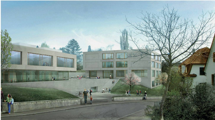
01 Zur Ausarbeitung: «Diego» (Visualisierungen + Pläne: Projektverfassende)