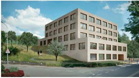
03 «Bungert»: kompakter Bau im grünen Hang