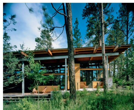
05 Kultivierte Wildnis rund um das Ferienhaus in Montana

Eine lobende Erwähnung erhielt der interkulturelle Gemeinschaftsgarten in Wien Floridsdorf. 25 Familien aus dem benachbarten Gemeindebau haben das öffentliche Abstandsgrün in individuelle 10–15 m 2 grosse Gartenparzellen verwandelt. Eine weitere Fläche dient als Gemeinschaftsgarten für alle AnwohnerInnen. Die Abgeschlossenheit inszeniert hingegen das zweite lobend erwähnte Projekt: Ausserhalb eines Umgriffs von 1.5m um ein Ferienhaus am Ufer des Flathead Lake in Montana wird die Natur geschützt und behutsam ergänzt.