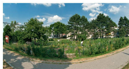
04 Nachbarschaftsgarten im Gemeindebau in Wien Floridsdorf

Der internationale Wettbewerb «Best Private Plots – Die besten Gärten» wurde zum vierten Mal vergeben. Das Ergebnis zeigt einige fast ungestaltet wirkende Gärten von XS bis XL.