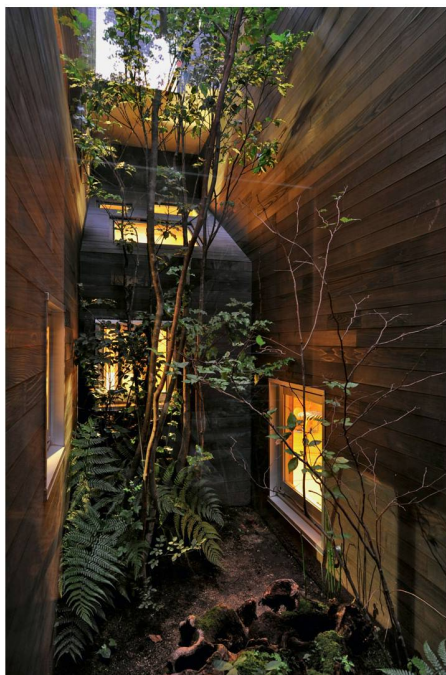
01 Miniaturwald im Innenhof eines Geschäftshauses in Fukuyama