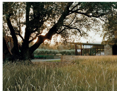
03 Grosse Grasflächen prägen die kalifornische «Stone Edge Farm»