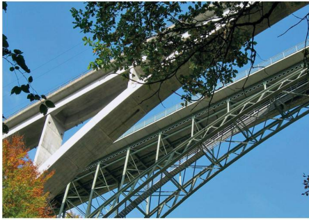
01 Schwarzwasserbrücke

Ob Ingenieure nur «introvertierte Rechenknechte» sind, wie der Titel einer Podiumsdiskussion der SIA-Berufsgruppe Ingenieurbau (BGI) suggeriert, oder sich als solche empfinden, sei dahingestellt. Tatsache ist, dass es eine lange Tradition unter den Ingenieuren gibt, sich an Fachtagungen auszutauschen. Dabei können interessante Praxisaufgaben diskutiert und neue Erkenntnisse gewonnen werden. Nicht zuletzt sind Fachtagungen auch bewährte Anlässe, um interdisziplinär und interkulturell zusammenzukommen. Verschiedene dieser Ingenieurtagungen blicken mittlerweile auf eine lange Serie von Durchführungen zurück und haben dabei ein interessiertes Stammpublikum