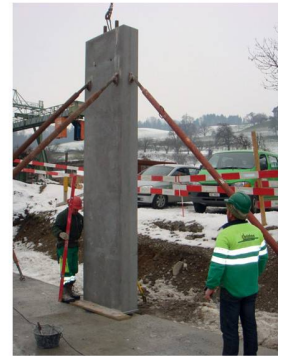
Die fertig versetzte und fixierte Stütze

Aufgrund des Stützenquerschnittes und der -gösse erfolgte die Produktion in liegenden Holzschalungen, welche von der BRUN-eigenen Schreinerei massgenau hergestellt wurde. Die diversen Einlagen erforderten von den Produktionsmitarbeitern ein exaktes Verlegen der Längsarmierung und natürlich ein millimetergenaues Montieren der Anschlussarmierungen sowie der Ankerschienen. Nach der Kontrolle der Armierung und Einlageteile erfolgte die Freigabe zum Betonieren durch den Hallenmeister.