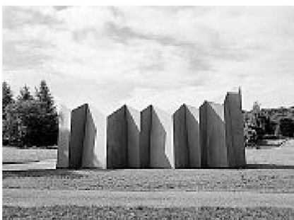
14 9 pavillons pour le Parc des Rives, Yverdon-les-Bains, 2007 Laurent Saurer, Lausanne, Localarchitecture