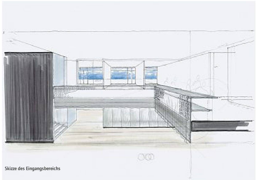
Skizze des Eingangsbereichs

Betrachtet man noch einmal die Fassade vom Eingang her, fällt linkerhand ein nach aussen erweiterter Kubus auf. Hier befindet sich, von allen Räumen direkt zugänglich und über eine offene Galerie einsehbar, der so genannte Bühnenraum (Studio/Theatersaal). Dieser dunkel gehaltene Raum macht es Atelier Oi möglich, raumgreifende Experimente und Szenografien in einer realistischen Umgebung auf ihre Wirksamkeit und Wirkung hin zu testen. Aktuell beschäftigen sich die Designer in einem Experiment mit geschlitzten Textilien in rotierender Bewegung. In zahlreichen Projekten taucht das Ausloten des räumlichen und materiellen Potenzials von Stoffen immer