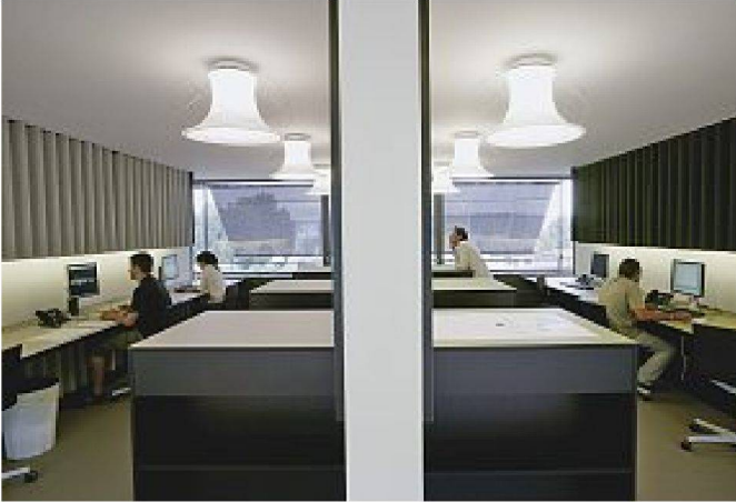
Der zentrale Bühnenraum (oben und rechts) ist von allen Räumen zugänglich und einsehbar, die Büros (unten) erscheinen nüchtern und grosszügig.