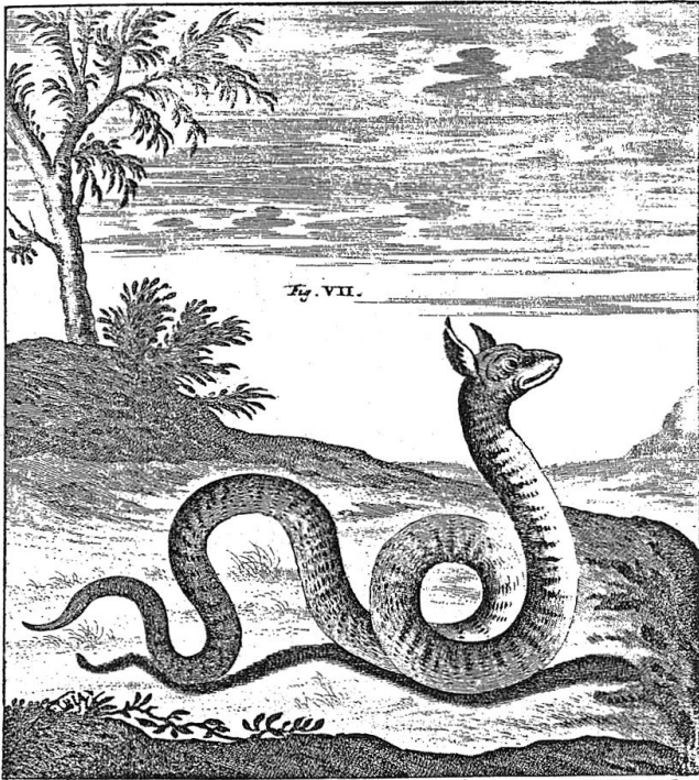
Ein Drachen der Alpen (in: Johann Jakob Scheuchzer: Οὐρεσφοίτης Helveticus sive Itinera per Helvetiae alpinas regiones facta annis 1702–1707, 1709–1711, 4 Bde., Lugduni Batavorum 1723, Bd. 1, Taf. VIII).

Die Berichte und die Beobachtungen seiner Reisen in die Alpen stellte der Zürcher Wissenschaftler u.a. in den Itinera Alpina und in der dreibändigen Natur-Historie des Schweitzerlandes (Zürich, 1716–1718) dar, wo er sich mit den Grenzen und der Beschaffenheit der Berge, den Wasserläufen, den atmosphärischen Phänomenen, den Mineralien, den Fossilien usw. befasste. 9