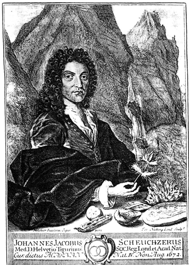
Porträt Johann Jakob Scheuchzers aus dem Jahre 1672 (in: Johann Jakob Scheuchzer: Ούρεσφοίτης Helveticus sive Itinera per Helvetiae alpinas regiones facta annis 1702–1707, 1709–1711, 4 Bde., Lugduni Batavorum 1723).