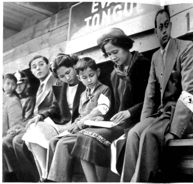
Verwante und Bekannte vom siamesischen Rennfahrer Prinz Bira verfolgen die Zeiten der Rennfahrer