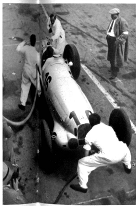
Auf die Sekunde kommt es an. Tanken, Hinterräder wechseln und dem Fahrer den Durst löschen alles insgesamt in 30 Sekunden