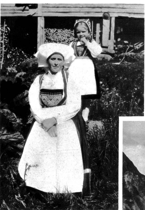
Tracht im Hardangerfjord

alltaglich verflart. — Im Norden endlich, wo in Narvik die nordlichste Bahnlinie der Welt endet, das Wunder der Loffoten und Westeraalen, Lyngnesfjord und Nordkap, Ziele jeder Nordlandfahrt. Man vergift nie wieder, wie sich die Landschaft an der Grenze der Arktis verwandelt. Manchmal an den veranderten Birken, die da wie struppige Delbaume wachsen, glaubt man in der Provence zu sein. — Der Wald aber, der gewaltige, frostherrschte Winterwald, ist noch lange wie das letzte Marchen der Natur, vor dem der grausame Entzauberer Mensch Halt machen mute. — —