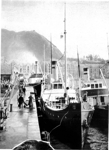
Im Hafen von Ålesund