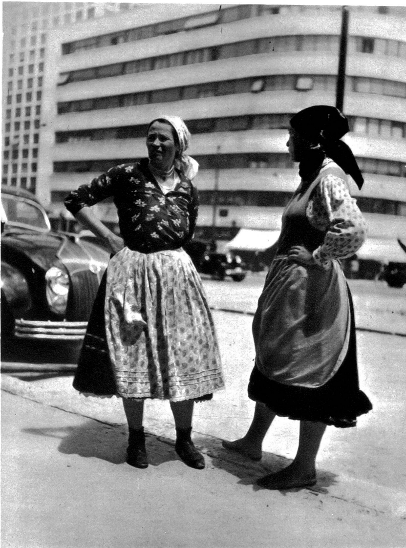
Rumänische Bauernfrauen, deren Männer in Neubauten beschäftigt sind, warten auf den Arbeitsschluss auf den Bauten.