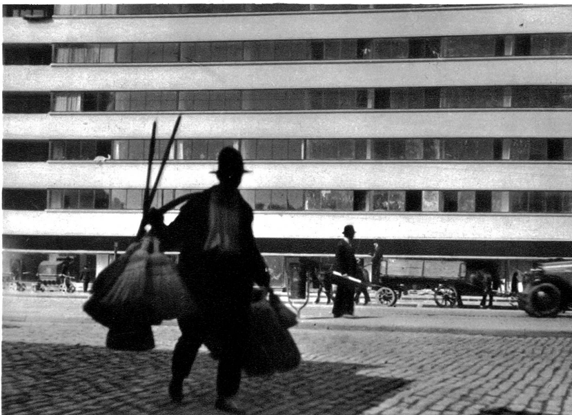
Der Besenhändler im neuen Viertel. Ob er seine Ware nicht bald mit Staubsaugern auswechseln wird?