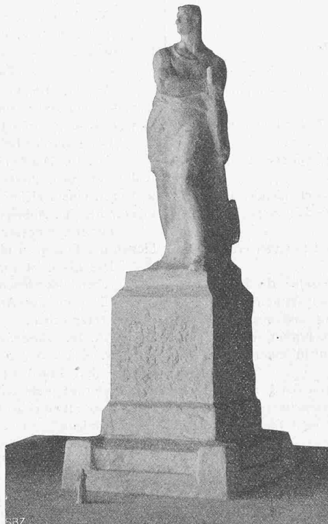
Nr. 79 des Nationaldenkmal-Wettbewerbes. Motto: «Granit». — Verfasser: Bildh. Dr. R. Kissling.

d) Die Knickungsgefahr der Säulen und Druckglieder ist bei zentrischer Druckbeanspruchung nicht näher zu berücksichtigen, wenn das Verhältnis von Gesamtlänge zum kleinsten Durchmesser