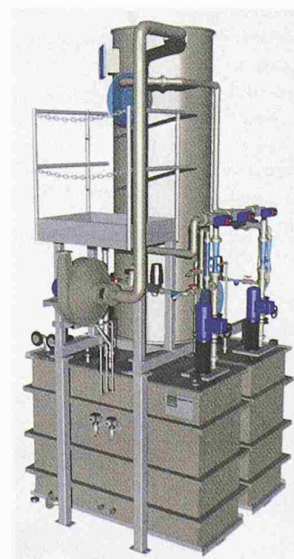
3-D-Darstellung des Abluftwäschers Typ RVE 1000-S der Colasit AG mit allen erforderlichen Systemkomponenten

Colasit AG 3700 Spiez Tel. 033 655 61 61