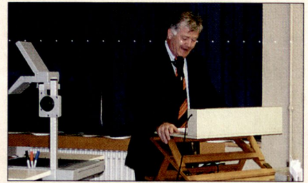
Ständeratspräsident Bruno Frick.