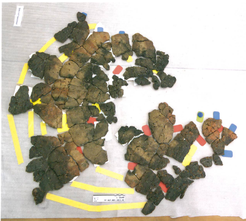
Abb. 1: Attiswil, Wiesenweg 15/17. Das Gefäss zu Beginn der Zusammensetzung: Die über 1200 Scherben sind noch flächig ausgelegt.

Im November 2013 brachte die Grabungsequipe der Fundstätte Attiswil BE, Wiesenweg 15/17, eine bronzezeitliche Keramik in das Konservierungslabor des Archäologischen Dienstes. Das Gefäss wies mit einem Durchmesser von fast 50 cm eine beachtliche Grösse auf. Es war zerdrückt und stark fragmentiert, aber schein-