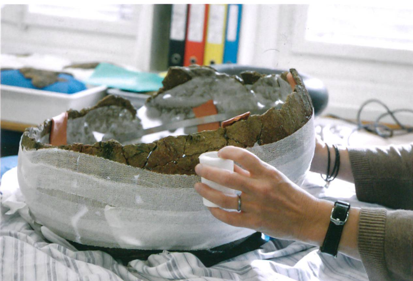
Abb. 5: Attiswil, Wiesenweg 15/17. Das mit selbsthaftender Binde umwickelte Gefäss, bevor es gedreht wird.

gewöhnlich getan wird. Ausserdem beeinträchtigte der sehr stumpfe Winkel zwischen Boden und Bauch von etwa 140° die Standfestigkeit des Objekts. Damit eine Chance besteht, dass der untere Teil die Last des oberen Teiles tragen kann, hätte um den Boden herum eine aufwendige Strebekonstruktion aufgebaut werden müssen. Gemäss Auskunft der Restauratorin Erika Berdelis, die experimentelle Archäologie praktiziert, wurde das Objekt seinerzeit aus mehreren Teilen hergestellt. Dies lassen auch die Bearbeitungsspuren des Töpfers vermuten. Das Gefäss muss sich schon bei seiner Herstellung unter dem Gewicht des oberen Teils abgesenkt ha-