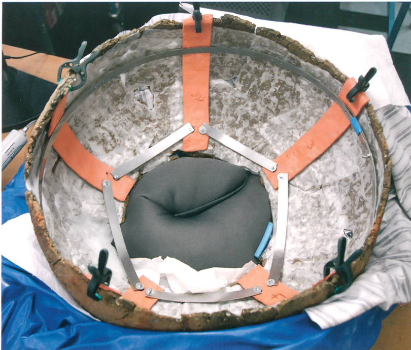
Abb. 4: Attiswil, Wiesenweg 15/17. Stützstruktur der Innenseite. Metallringe halten die Streifen aus luftgehärteter Knetmasse an der richtigen Stelle.