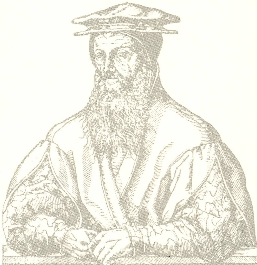
Conrad Gessner 1516–1565

Swiss Journal of the History of Medicine and Sciences Vol. 56 (1999) N° 3/4