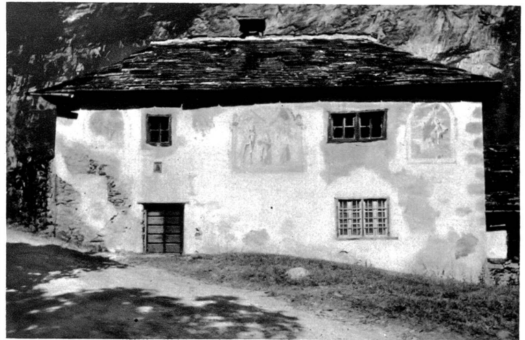
Patrizierhaus in Cauco-Bodio mit Wandmalereien