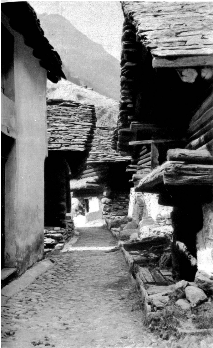
Dorfbild in Rossa