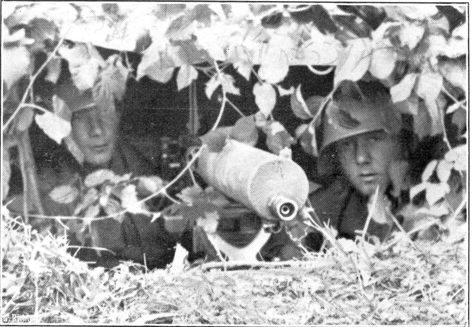
Zu den Manövern der 3. Division

Am 20. September wurde die Herbstsession der Eidgenössischen Räte eröffnet. Im Nationalrat eröffnete Präsident Troillet Sitzung und Session mit einem sympathischen Nachruf auf den verstorbenen Freiburger Nationalrat Benninger. Hierauf begann sofort die Behandlung betr. „Verlängerung und Anpassung des Fiskalnotrechtes für das Jahr 1938“. Im Ständerat teilte Vizepäsident de Weck mit, daß sich Präsident Hauser wegen Krankheit für die Dauer der ganzen Session entschuldigen lasse. Hierauf gedachte er ebenfalls des verstorbenen Nationalrates Benninger. Hernach referierte Löpfle (St.