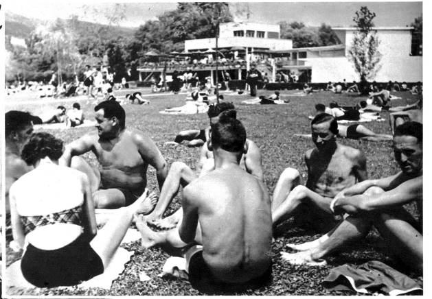
Im gemütlichen Freundeskreise lässt sich gut diskutieren