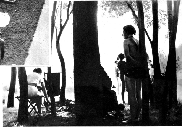
Welch lauschige Plätzchen dieses Strandbad aufweist!