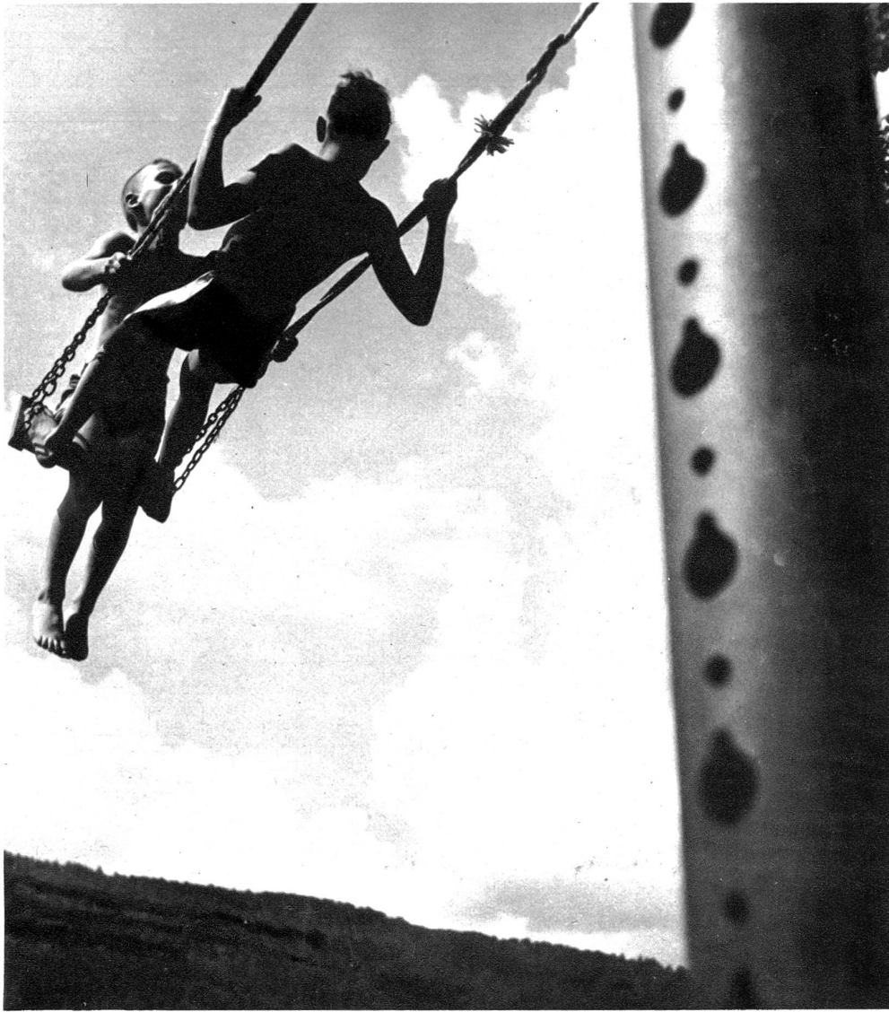
Im Badhöschen auf der Schaukel, o welche Lust für die Kinder