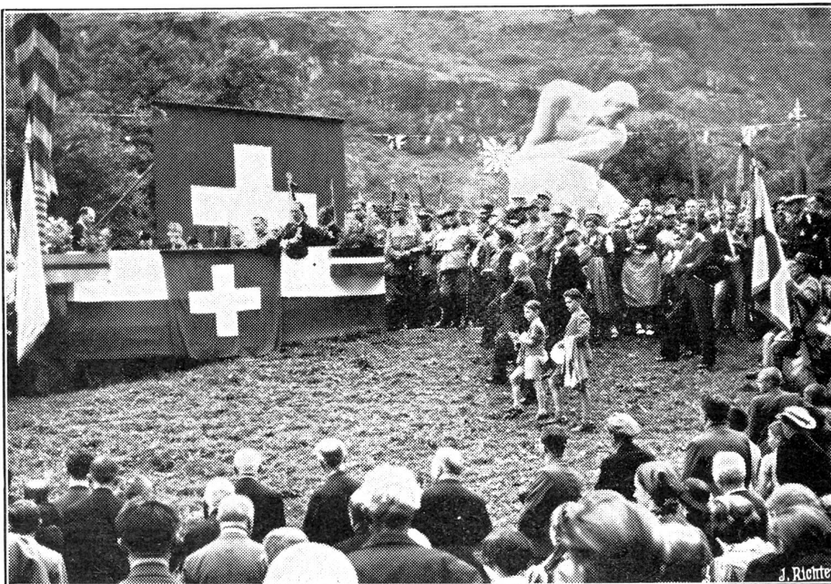
Einweihung des Schlachtdenkmals von Giornico.

Genf beging die Feier mit einem großen Umzug, an dem sich die vaterländischen