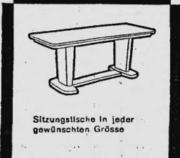
Sitzungstische in jeder gewünschten Grösse

Facit-Vertrieb AG Zürich 1 Selnastrasse 6 Tel. 051/27 58 14