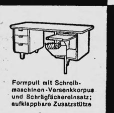
Formpult mit Schreibmaschinen-Versenkkorpus und Schrägfächerersatz; aufklappbare Zusatzstütze