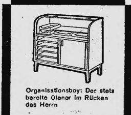
Organisationsboy: Der stets bereite Olenar im Rücken des Herrn

Wichtig! Kennen Sie schon unseren Büromöbel-Service? Unsere Schreiner stehen Ihnen für Reparaturen jederzeit zur Verfügung!