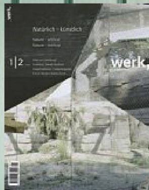
1-2 | 09 Natürlich-künstlich