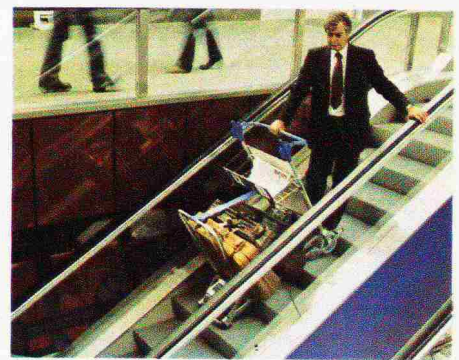
Bild 1. Rolltreppengängiger Gepäckrolli

eigens für den Bereich des ganzen Flughafens ein neuartiger, rolltreppengängiger Gepäckrolli geschaffen worden (Bild 1). Damit verlieren die Rolltreppen für den mit Gepäck beladenen Reisenden viel von ihrem Schrecken. Von Betriebsbeginn an stehen 1200 derartige Wagen im Flughafen zur Verfügung. Eine gemeinsame Organisation aller Flughafenpartner sorgt dafür, dass auf den Perrons und in den Ankunftsflughallen die nötige Anzahl von Rollis auf ihre Benützer warten.