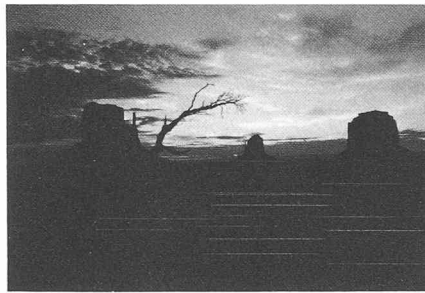
L'Amérique des films de cow-boys!

J'ai suivi des exposés concernant le génie médical, par intérêt personnel pour l'interaction entre la médecine et les sciences de l'ingénieur, par exemple lorsqu'il s'agit de déterminer les contraintes dans un os, où l'on applique à un problème médical les méthodes d'investigation qu'on nous enseigne à l'EPFL. Il y a là matière à un dialogue entre l'ingénieur et le médecin, sans qu'il y ait subordination de l'un à