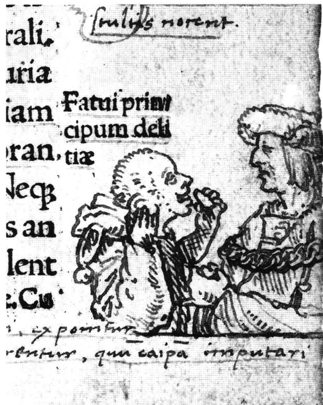
Abb. 7 Kaiser Maximilian und sein Hofnarr, von Hans Holbein d. J. Feder, Randzeichnung in: Erasmi Roterodami encomium moriae i. e. Stultitiae laus, Johannes Froben, Basel 1515, fol. H 4. Basel, Öffentliche Kunstsammlung, Kupferstichkabinett, Inv.-Nr. 1662. 166.