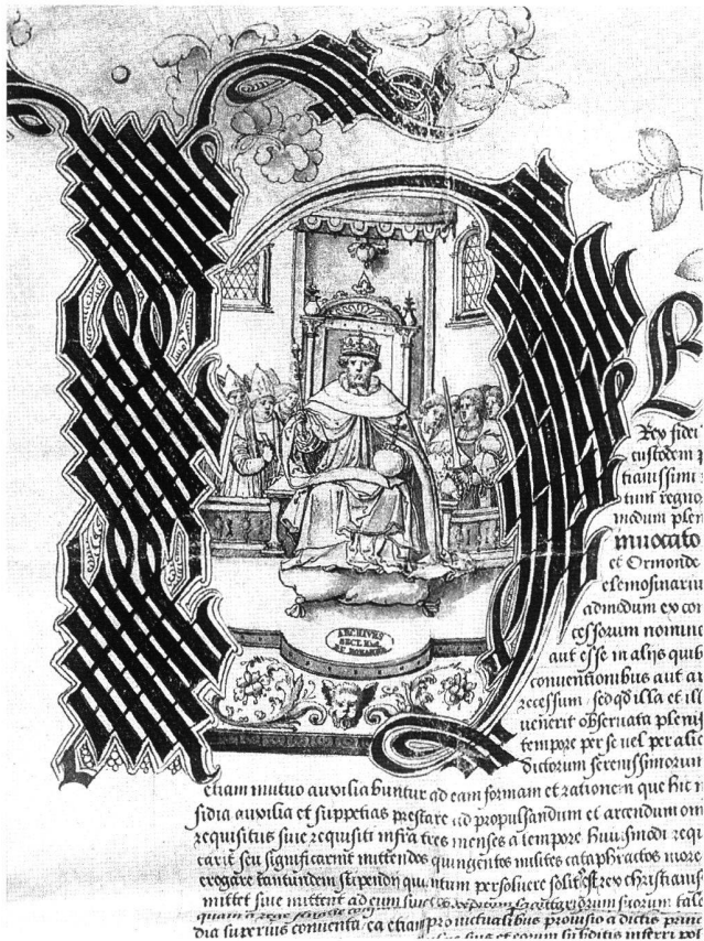
Abb. 4 Initiale mit Heinrich VIII., von Lucas Horenbout (?), in: Vertrag von Windsor, 1532. Feder (braun), braun laviert auf Pergament. Paris, Archives Nationales, AE III 31.

Um Ähnlichkeit zwischen Salomo und Heinrich aufzuzeigen, hätte Holbein das Band unterhalb von Salomos Knie, welches sofort an den Hosenbandorden erinnert, wie in Whitehall und dem Barbers-Bild, als solchen deutlich kennzeichnen können. Damit wäre der Zusammenhang zwischen historischer und biblischer Figur deutlich geworden. Salomos «Strumpfband» ist aber Teil seiner Sandale.