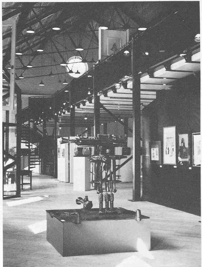
Aus einer alten Militärreithalle in ein Museum für zeitgenössische Kunst umgestaltet: der aus der «Gründerzeit» stammende, ehemalige Kasernenbau auf Schloss Gottorf bei Schleswig

In der Begründung der Jury heisst es u.a.: «Eine alte Reithalle wird neu benutzt für die Ausstellung zeitgenössischer Kunst. Durch das Betonen der vorhandenen konstruktiven Elemente und den Einbau von Empore, Treppen, Eingängen und Beleuchtung erhält der vorgegebene Raum unter folgerichtiger Verwendung von Stahl eine neue Qualität. Das geschieht mit einfachen Mitteln und grossem Einfühlungsvermögen. Aufwand und Nutzen bei der Verwendung von Stahl