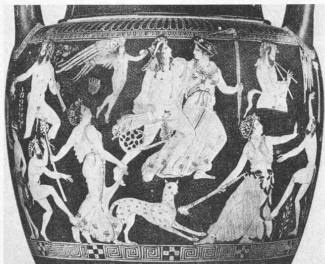
Dionysos und Ariadne, um 400 v. Chr.

lichen Dokumente, die uns aus der Zeitspanne zwischen ungefähr 1000 v. Chr. bis 400 v. Chr. erhalten sind. – Die griechische Malerei aus dieser Epoche ist uns in nur wenigen Beispielen überliefert. Die Arbeiten römischer und alexandrinischer Kopisten mögen zwar recht zutreffenden Aufschluss über ihre Vorbilder vermitteln. Doch bleibt ihnen das Zeichen des Nachgeschaffenen, das, in anderem Geiste beheimatet, bei aller Kunstfertigkeit eben doch Widerspiegelung, Abglanz ist. Umso höher ist auf diesem Hintergrund die Bedeutung der griechischen Keramik einzustufen. Über die ungeheure Vielfalt der Formen spannt sich gleichsam als köstliches Flechtwerk die Darstellung des griechischen Menschen in den feinsten Verästelungen seiner Lebensäusserungen, seines alltäglichen Daseins und seiner künstlerischen Ausdrucksweise. Es sind originale Werke im ursprünglichen Wortsinn, die in Grabstätten, vornehmlich etruskischen, die Jahrhunderte überdauert haben.