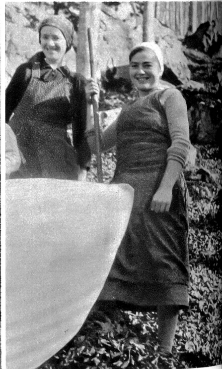
Ist ein Laubsack prall gefüllt, dann wird er zugenäht

Seit Tagen ist der Föhn, der wilde Geselle, durch die Täler gebraust, hat in den Hausfirsten georgelt und das Laub von den Nesten geblasen. Da erging der Ruf in den Seeztaler Dörfern „Morgen ist allgemeiner Laubtag“, und am frühen Morgen führen die Ortsbürger mit Wagen, Laubsäcken, Buchenreisbellen und Rechen hinauf in den Buchenwald, wo der Föhn das dürre Laub in den Furchen und Hohlwegen zu Haufen zusammengeblasen hatte. Nur ein Drittel der bezugsberechtigten Bürger ist heuer zum Bettlauben erschienen. Es ist nicht mehr allgemeiner Brauch wie früher, in den Ritterburgen, Bürgerhäusern und Bauernkammern auf Laubsäcken zu schlafen, und manche, die hier gekommen sind, sammeln das Laub nur noch als Streue für die Haustiere, und nicht mehr um darauf zu schlafen. Und