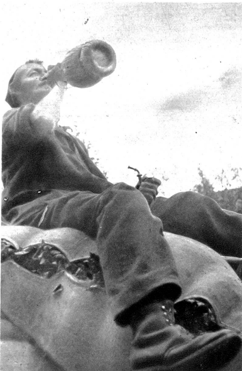
Das Bettlauben hat Durst gegeben