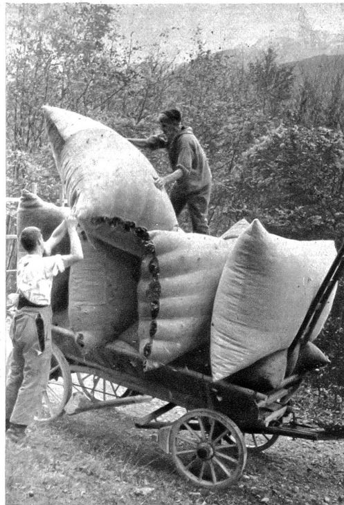
Hoch wird das Fuder geladen