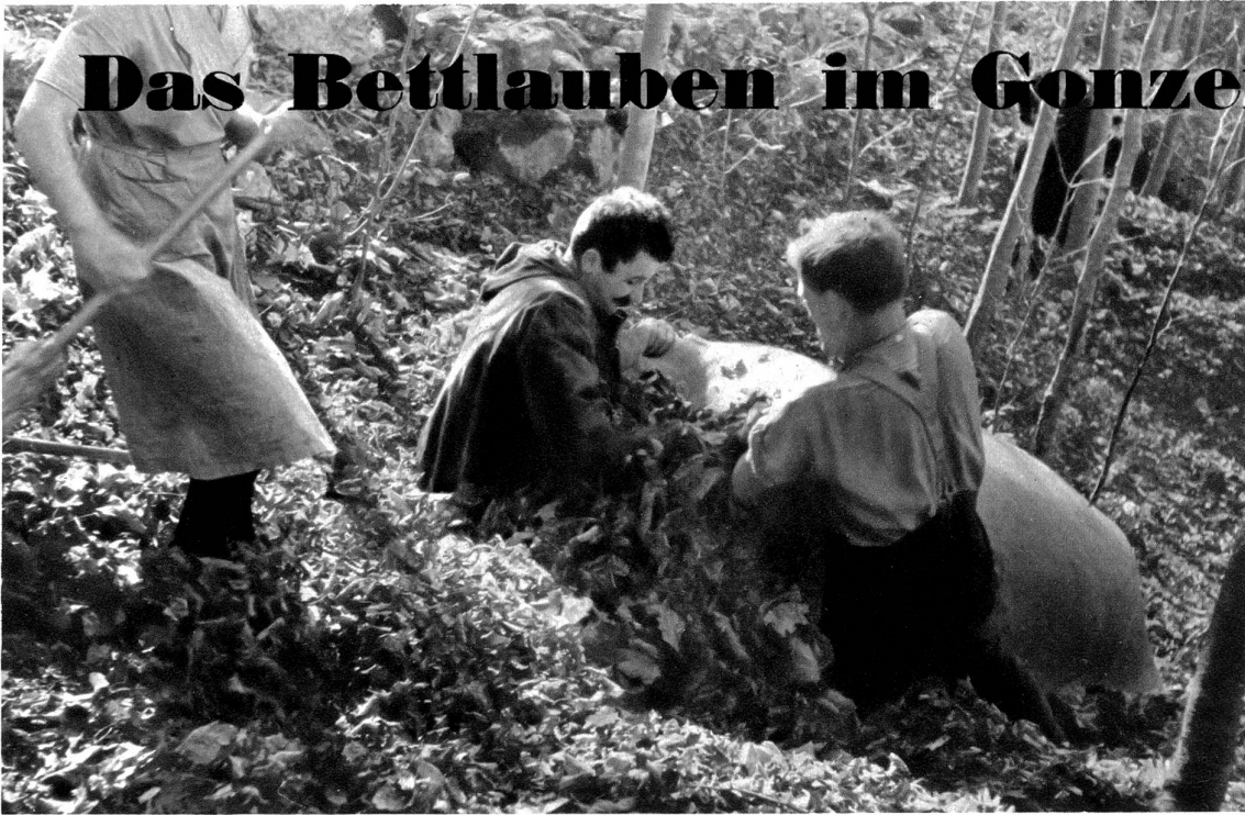
Die Laubsäcke werden mit Laub vollgestopft