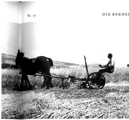
Rascher und müheloser mäht es sich doch mit der Maschine

lied des Feldes aufsteigt mit Lärchenfang in die strahlende Unendlichkeit. Wo eine ganze Welt für sich, mit und in dem Felde entstanden und geboren, ihr Leben in Wachsen, Blühen, Reifen und Genschen vollendet. Wer diese Welt kennen lernen will, der muß sie lieben, der muß sie lieben mit Heimgatliebe, und er muß sie von Kindheit an befauchen, heimlich und andachtsvoll, in all ihren tiefsten Verborgenenheiten und Wundern. Von der Sandstrafje aus