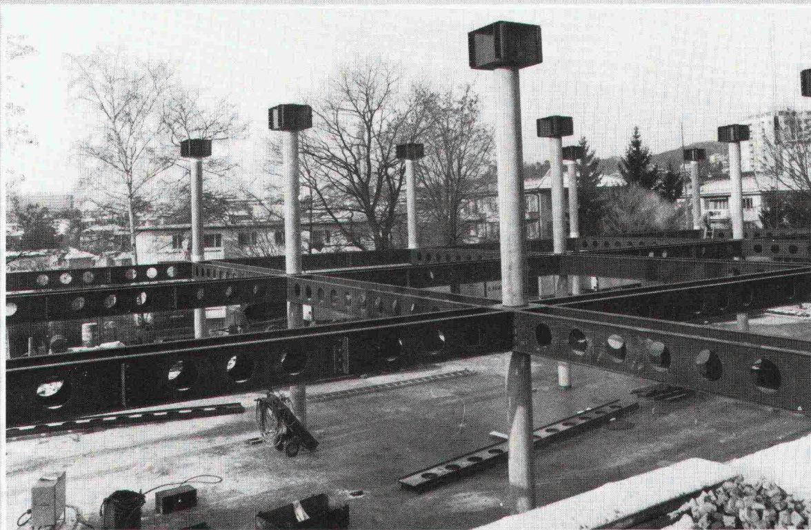
Ecole nouvelle de la Suisse romande, Chailly. Architekt: Réalisations scolaires et sportives, Lausanne Ingenieur: Techn. Büro PIGUET, Ing. conseils, Lausanne

Herausgeber: Verlags-AG der akademischen technischen Vereine