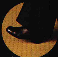
hoher, sicherer Gehkomfort