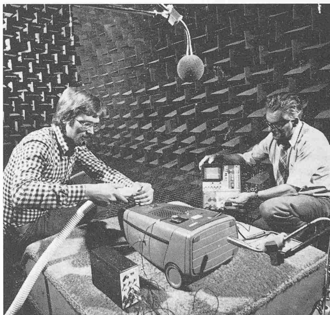
Inneres des schalltoten Raumes, in dem Schallmessungen an einem Staubsauger durchgeführt werden. Wände, Fussboden und Decke sind mit speziell profilierten Blöcken aus einem Material mit hohem Schallschluckgrad verkleidet