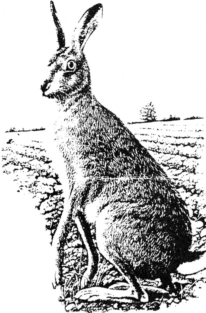
Sélection du Reader's Digest, Le Guide des animaux des champs et des bois , Paris - Bruxelles - Montréal - Zurich, 1989, p. 204