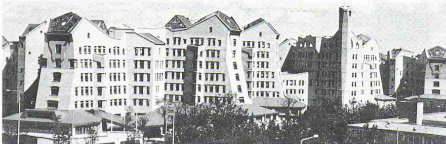
Prix du Royal Institute of Dutch Architects: Siège de la NMB Bank à Amsterdam, Alberts & Van Huut Architectes