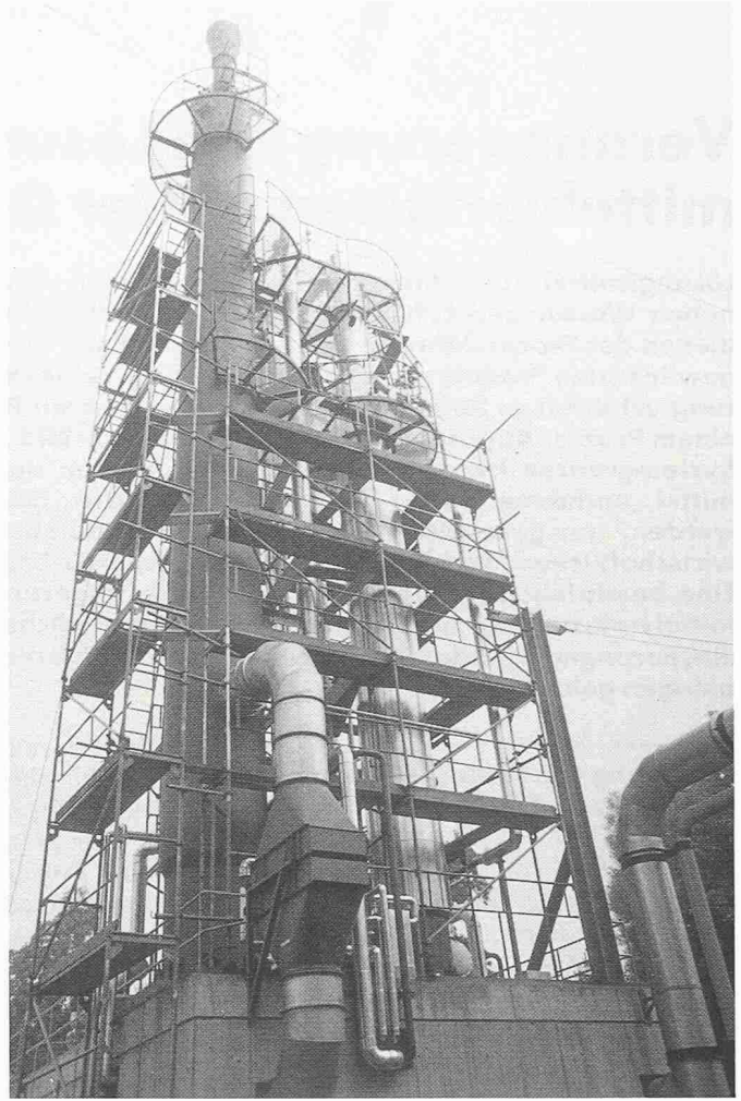
Bild 5. Anlage zur Rückgewinnung von Ethanol und Trichloräthylen aus einem Abluftstrom