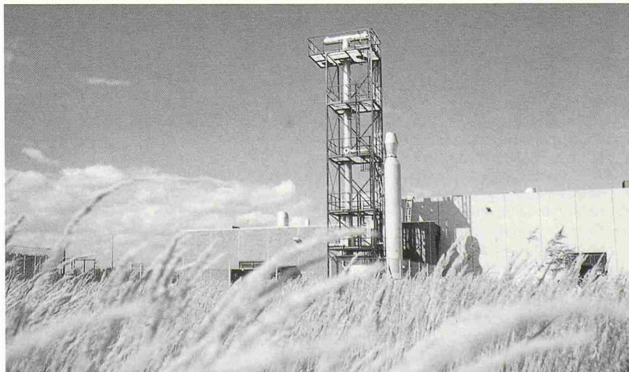
Bild 1. Isopropanolrückgewinnungsanlage für einen Pharmabetrieb