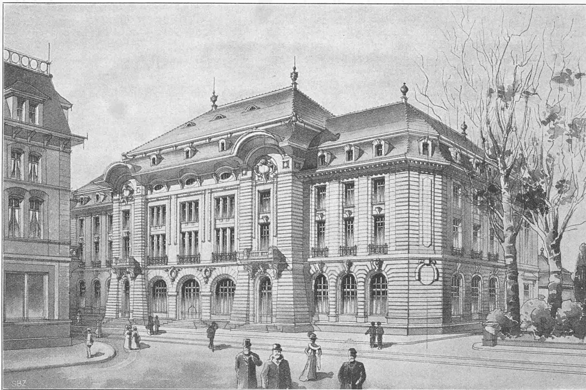
Perspektivische Ansicht vom Bahnhofplatz aus.

V. Preis «ex aequo». — Motto: «.A.» — Verfasser: Prince & Béguin, Architekten in Neuchâtel.