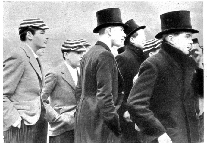
Kleiner Gentleman. Mit der ganzen Würde eines Gentleman schauen diese Etonboys dem alljährlichen Wall-Spiel zu, welches jeweils am St. Andrews Tag veranstaltet wird.