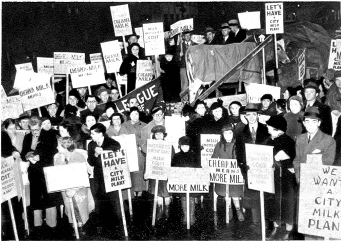
Der Schrei nach mehr und billiger Milch in Amerika. In New York fand eine öffentliche Protestkundgebung gegen die hohen Milchpreise statt, bei welcher Mütter und Kinder Plakate trugen mit der Aufschrift „Billige Milch, heisst mehr Milch“.