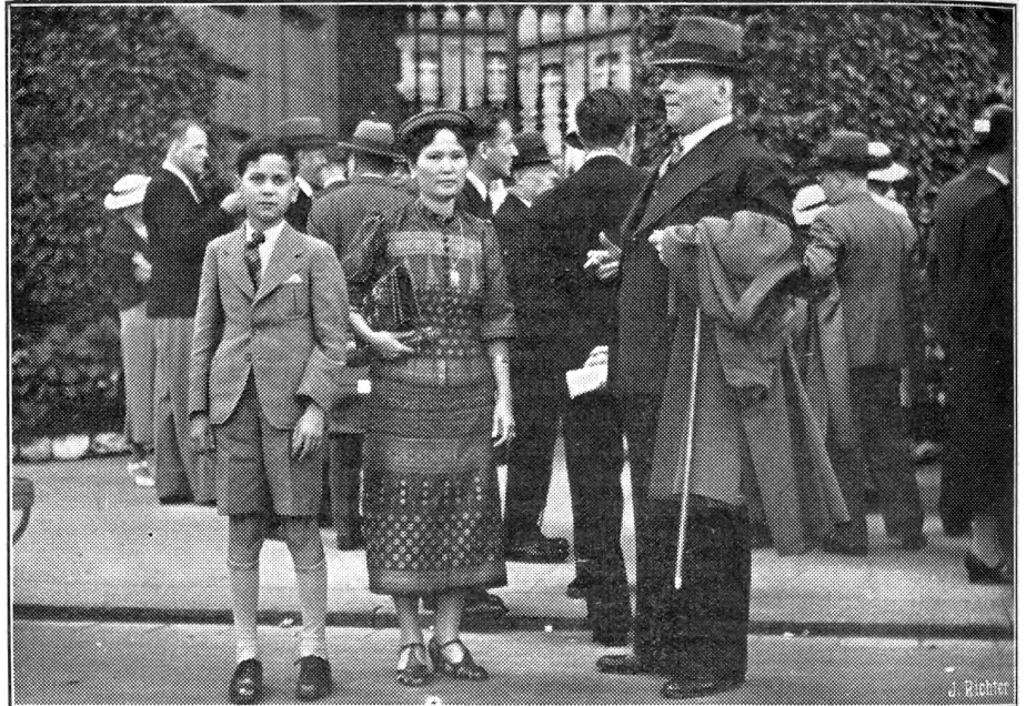
Auslandsschweizer in Bern

Die parlamentarische Behandlung der Freimaurerinitiative soll in der Herbstsession durchgeführt werden, damit die Abstimmung am ersten Dezembersonntag stattfinden könne.