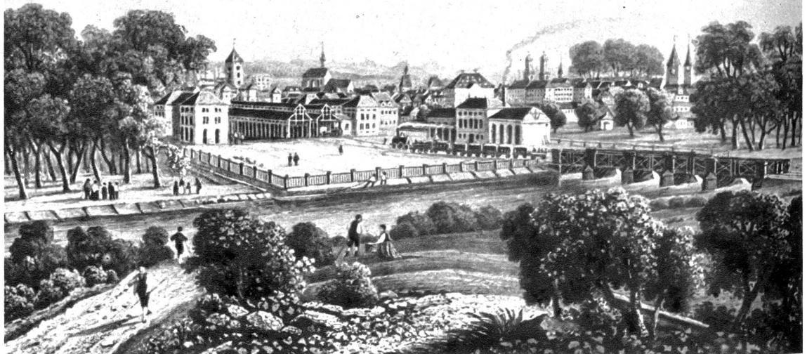
Erster Bahnhof Zürich, aus dem Jahr 1847