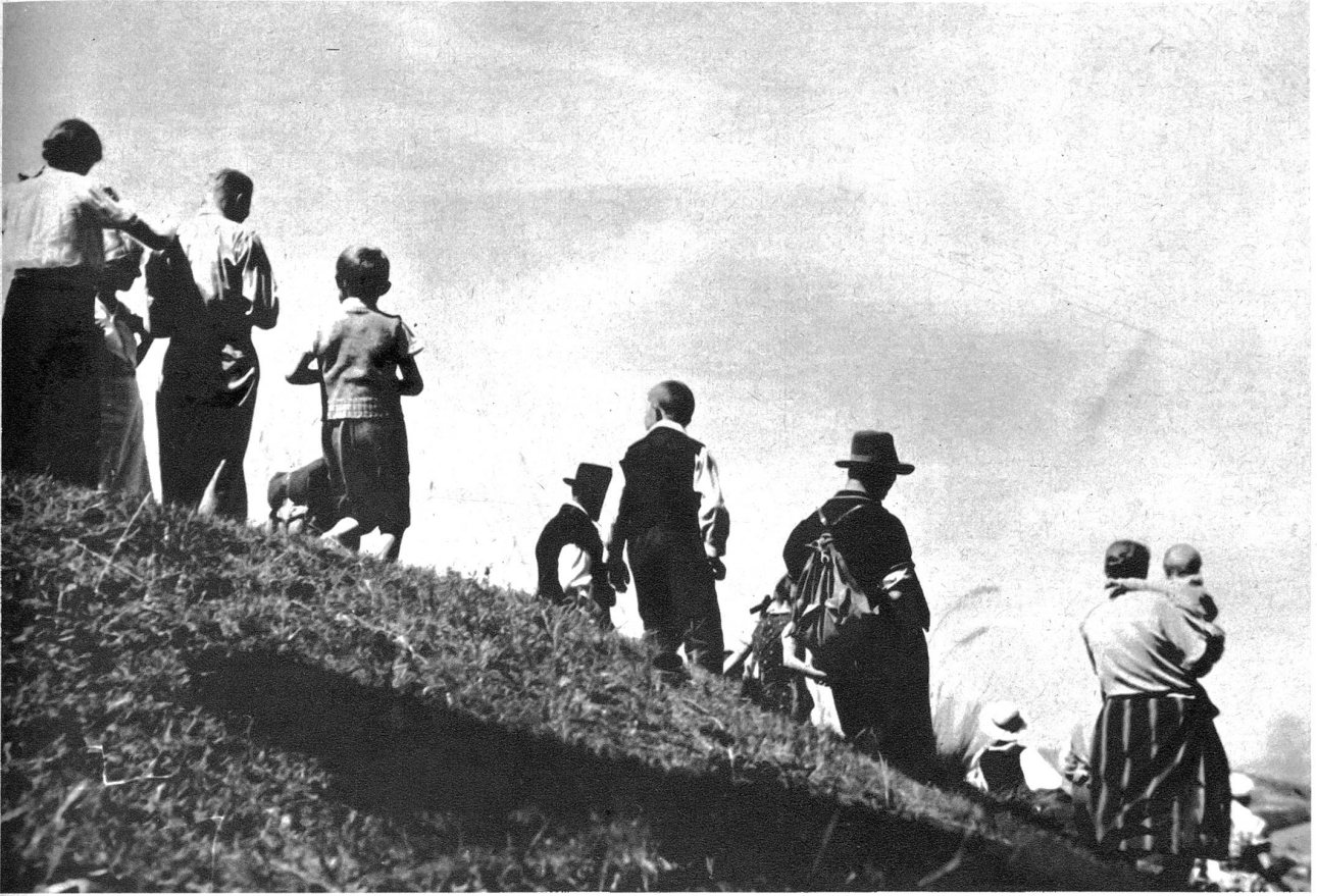
Wer zu klein ist zum Tanzen oder wer noch „z'tüe" hat, geht beizeiten heim