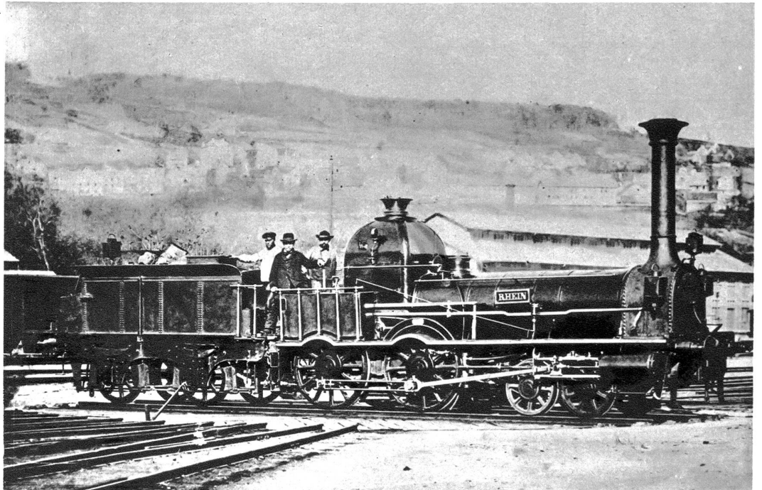
Die Lokomotive „Rhein" der ersten Schweizerbahn Zürich-Baden

jähriger Baudauer durchschlagene Schloßbergtunnel bei Baden, der erste Eisenbahntunnel in der Schweiz. Die vier Lokomotiven