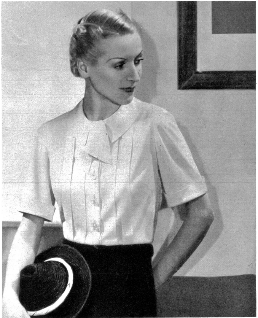
Nr. 1 Kleidsame Bluse aus weisser Waschseide; Stoffbedarf bei 0.80 cm Breite 2.20 m, bei 1 m Breite 1.70 m Zuschneiden und Heften Fr. 2.80

Die Rücksendung erfolgt prompt unter Nachnahme für das Zuschneiden.