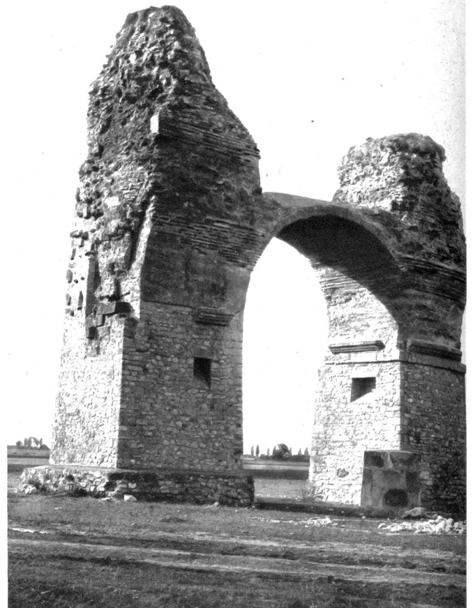
Das Heidentor bei Petronell, ein weithin sichtbares Ueberbleibsel aus der Römerzeit

Ein Donaudampfer gleitet durch sieben Länder; durch Deutschland, Oesterreich, Tschechoslowakei, Ungarn, Jugoslawien,