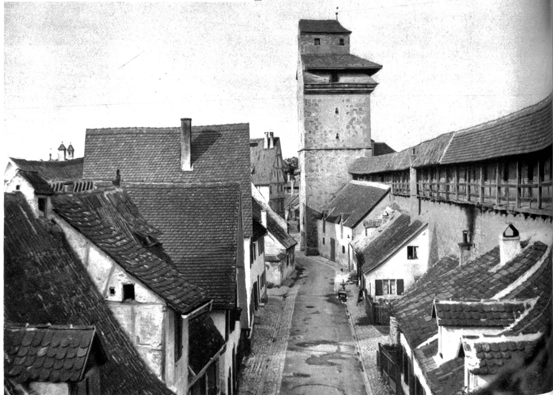
Nördlingen. Wehrgang und Reimlinger Tor.