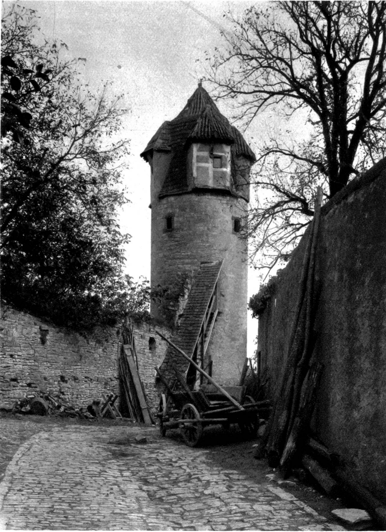
Alter Befestigungsturm in Sulzfeld am Main, baulich bemerkenswert durch die aus der Haube vorspringenden Erkerbauten

Ueberbleibsel alter, wirklich allgemeiner Volkskunst uns mehr lehrt und zeigt, als das beste Museum in der Lage ist, es zu tun. Aber sicherlich hat man sich damals auch Zeit genommen, oft und gern beim Dämmerstumpfen mit dem Baumeister, dem Nachbarn oder sonstigen Persönlichkeiten alle Einzelheiten der Pläne zu besprechen, und manch Schöpplerin „Eckendorfer Lump“ oder „Sommeracher Rabenkopf“, vielleicht auch ein „Küchenmeister“ mußte dran geglaubt haben, bis dann die „Leisten“ an die Reihe kamen. Wie heißt es doch heute im Liedchen: