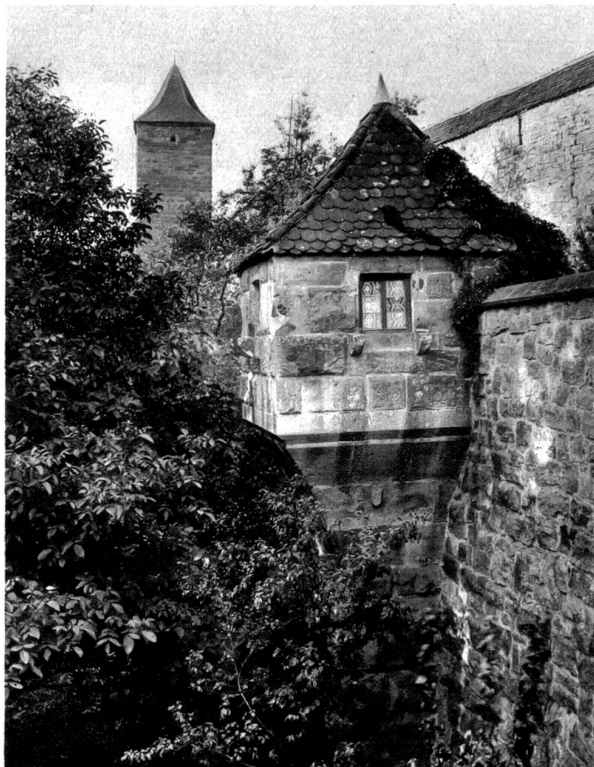
Rothenburg o. d. Tauber Erker (jetzt bewohnt) an der Stadtmauer in Rothenburg o. d. Tauber