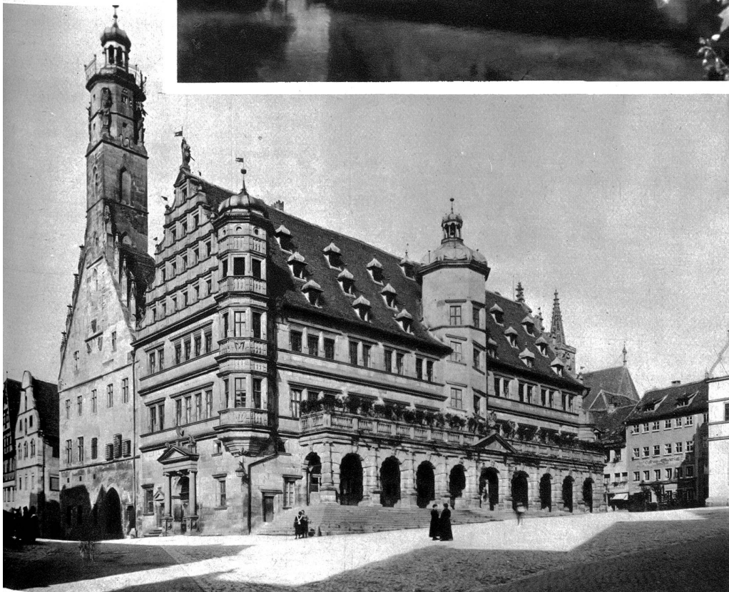
Das Rathaus in Rothenburg o. d. Tauber. Links der alte gotische Bau mit dem 55 m hohen Turm, aus dem Ende des 13. Jahrhunderts stammend, rechts der neuere Renaissance-Bau, 1578 vollendet, mit dem 1681 angefügten Laubengang.