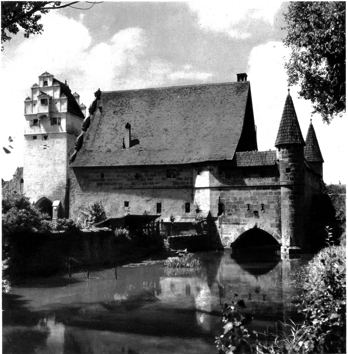
Dinkelsbühl, alte Stadtmühle