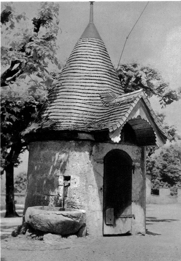
Zugbrunnen im Schlosshof

Da sind vor allen Dingen die Tore und Türme des Schlosses, welche uns Bilder von großem Reiz liefern, alte Häuser, auf und in die Stadtmauern gebaut — aus dem Grün des Schloßberges, Matten und Wald in prächtigen Farben hervor-