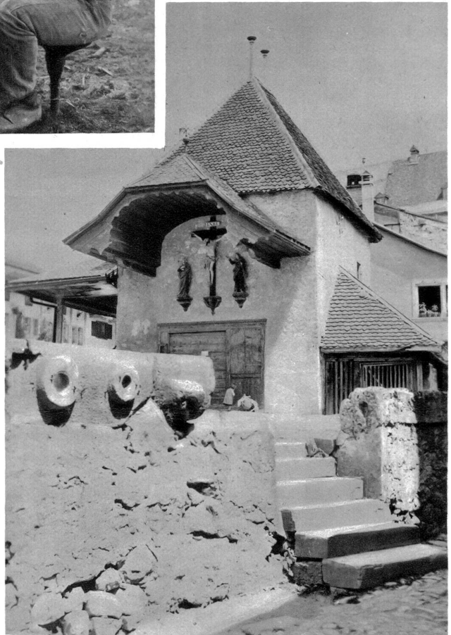
Interessanter Winkel in Greizer. Im Vordergrund die steinernen Getreidemaße

Und wo auch immer in diesem reizvollen freiburgischen Nest unsere Augen hinfallen — überall Bilder von ausgefuchter Schönheit, von besonderer Eigenart! So urecht in seinen engen Grenzen ein prächtiger Spiegel vergangener Jahre! Besonders in der einen breiten Gasse, — die Straße und Platz, alles in einem ist. Da finden wir Bilder, so packend in Farben und Linienführung, so unberührt von unserer hastenden Zeit, daß man glaubt, eine alte Merianische Zeichnung zu betrachten. Und all diese köstlichen Bilder altgreyerzischer Kleinkunst lösen in uns mit breitem Behagen Stimmungen aus, wie wir sie selten genießen.