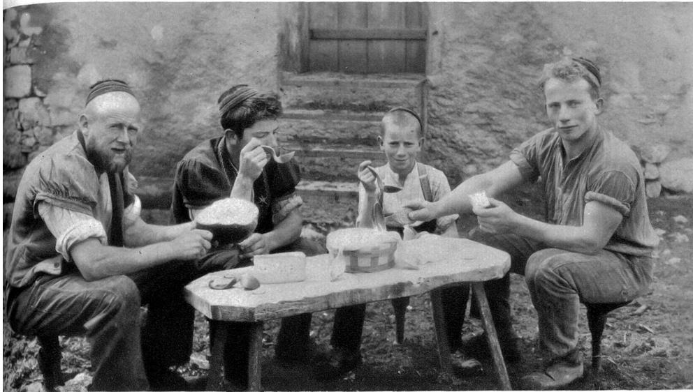
Greyerzer Küher am Mal

leuchtend. Gleichsam in der Luft liegt ein Hauch halb trozigen, halb kleinlichen Ackerbürgertums, stolz auf das Erbe der Väter und stolz auf die eigene Scholle, die in schwerer Arbeit genügsamen Menschen ihren Lebensunterhalt gibt. Ein Hauch von fröhlichem Frohsinn, von Glück und Selbstzufriedenheit liegt auf allem, der aber gut paßt zu den köstlichen und trozigen Loren und heimeligen Winkeln.