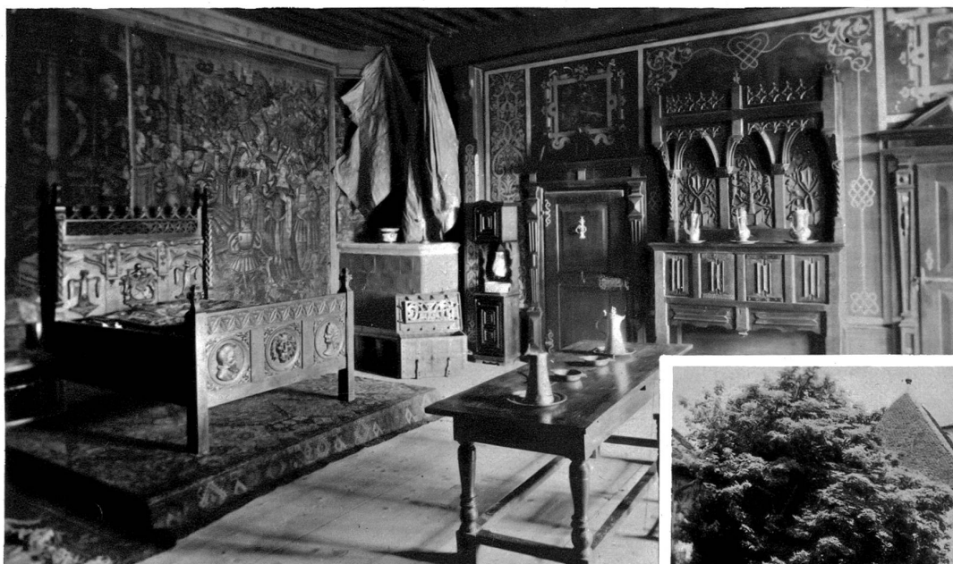
Schloss Greyerz Schlafgemach der Grafen

Es ist merkwürdig, mit wieviel sicherem Geschmack diese materische Kleinstadt angelegt worden ist, die in ihrem Aufbau und ihrer Silhouette so einwandfrei vor uns steht. Dieser künstlerische Instinkt muß auch den breiten Massen, dem gesamten Volke eigen gewesen sein, denn löbliche Baupolizeivorschriften nach unsern heutigen Mustern gab es sicherlich damals nicht. Hier fügt sich eines in das andere, dieses tritt hervor, jenes wird gemildert, und es entsteht so ein köstliches Ganzes, das ein Ueberbleibsel alter, wirklich allgemeiner Volkskunst uns mehr lehrt und zeigt, als das beste Museum in der Lage ist, es zu tun. Aber sicherlich hat man sich damals auch Zeit genommen, oft und gern beim Dämmerstoppfen mit dem Baumeister, den Nachbarn und vielleicht auch mit den Greyerzer-Grafen alle Einzelheiten der Plätze zu besprechen, und manch Schöpplein Wein wird notwendig gewesen sein, bis der Plan geboren war und die Ausführung beginnen konnte. Aber dieses gemüthvolle Zeithaben, das uns hier im Greyerzerländchen überall entgegentritt, bildet ja für uns moderne Menschen den Hauptreiz dieser alten Städtchen.