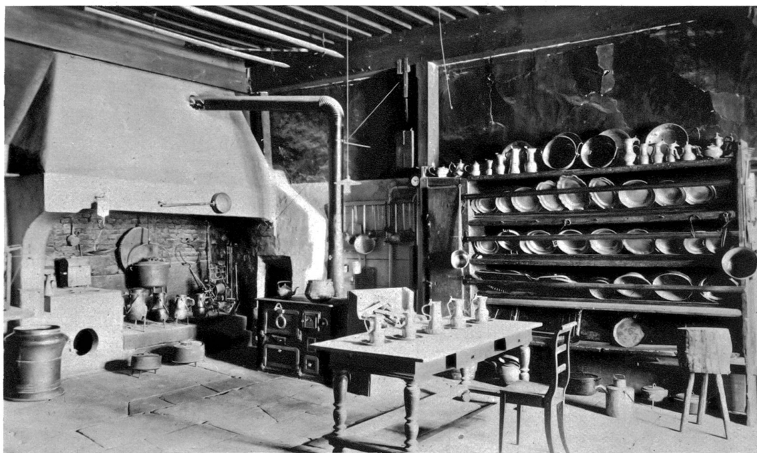
Schloss Greyerz Die Küche