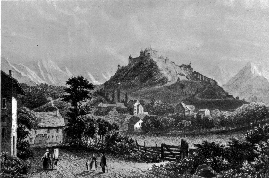
Greizerz. Nach einem alten Stich von Merian