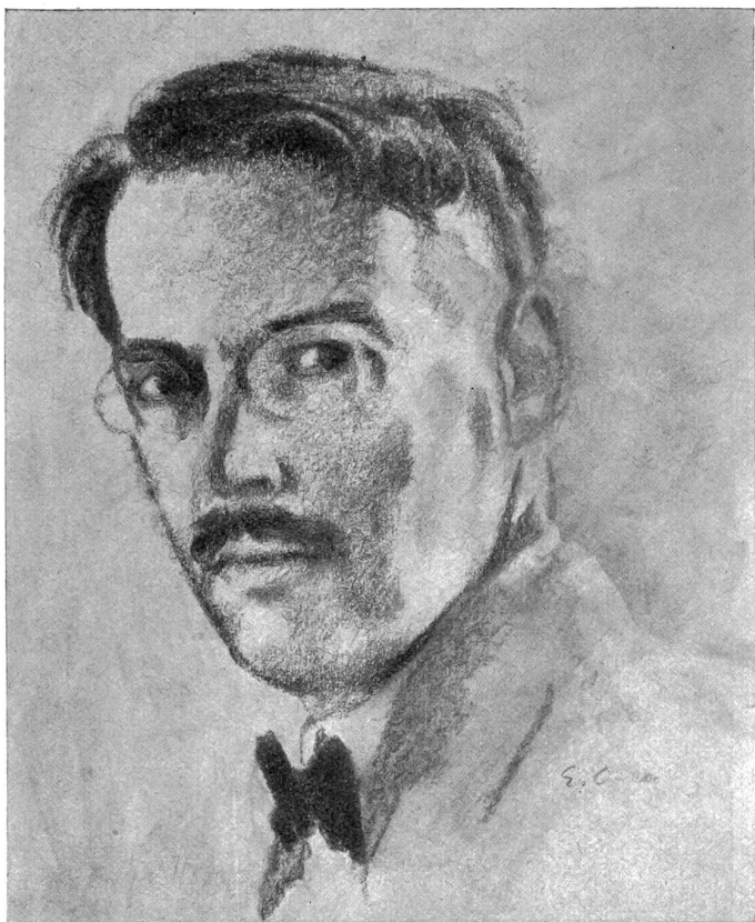
Emil Cardinaux — Selbstbildnis