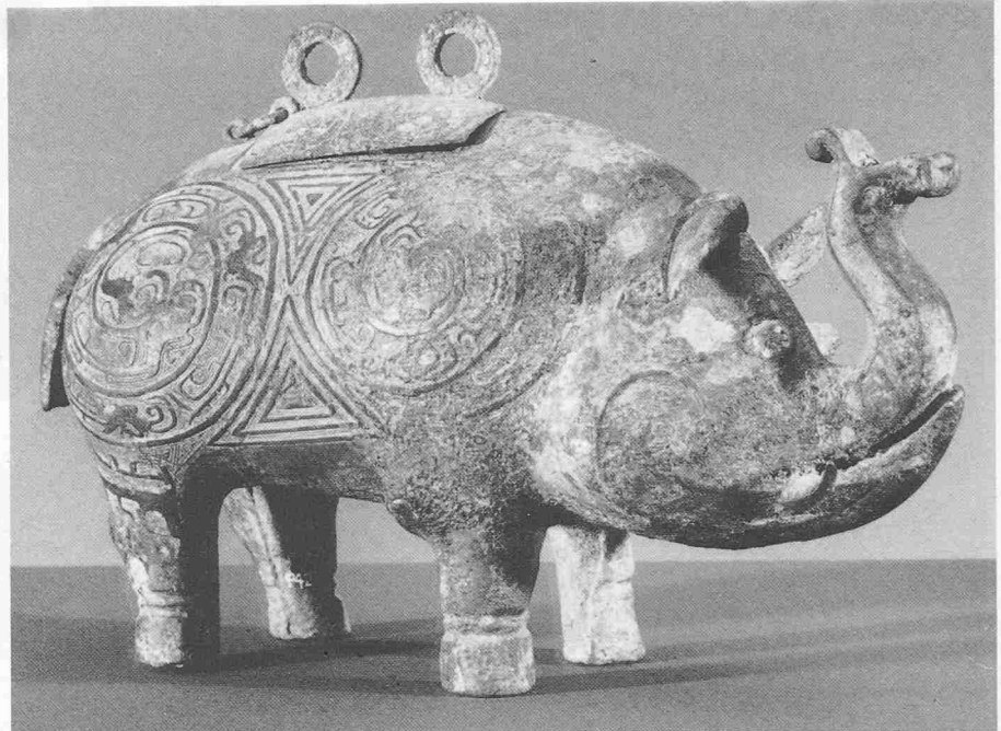
Zun in Gestalt eines Elefanten, westliche Zhou-Dynastie, 10. Jahrhundert v. Chr., Bronze